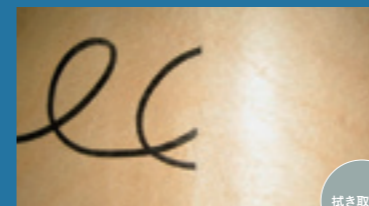
油性ペン試験(溶剤で拭き取り)