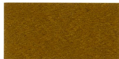
ZP-3500 オーク ブラック/20 透明ブラウン/30 イエロー/50