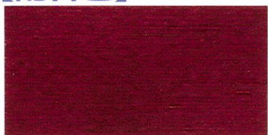
ZP-2100 ワインレッド ブラック/20 レッド/80