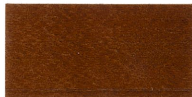
ZP-7500 オールナット ブラック/20 透明ブラウン/80