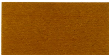
ZP-3700 チーク ブラック/10 透明ブラウン/40 イエロー/50