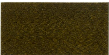
ZP-8200 クワイロ ブラック/50 イエロー/50