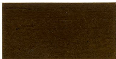
ZP-3600 ダークオーク ブラック/40 透明ブラウン/25 イエロー/35