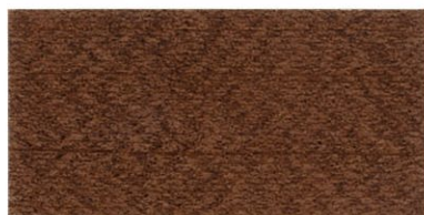
ZP-2300 マホガニ ブラック/45 レッド/45 イエロー/10