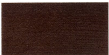
ZP-7600 ダークオールナット ブラック/60 レッド/35 イエロー/5